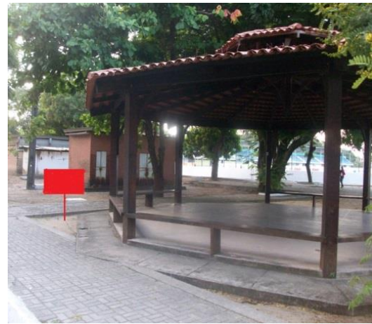
Figura 7: Local de implantação das placas, Coreto da Ed. Física.