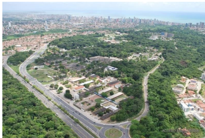
Figura 5: Campus I da UFPB, em João Pessoa – PB. Figure 5: Campus I of the UFPB, in João Pessoa – PB.

Dentre as áreas públicas existentes para a conservação do bioma no município, destaca-se a Universidade Federal da Paraíba (UFPB), área específica de nosso estudo, com seus fragmentos de Mata Atlântica no Campus I e no entorno do mesmo, equivalente a 43,70 hectares na área interna do Campus (Figura 5).