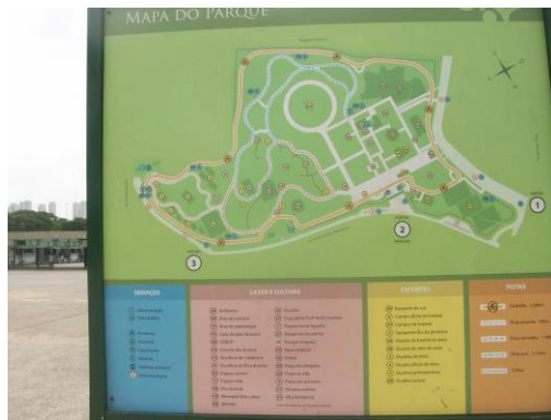
Figura 1: Parque Ibirapuera - São Paulo, Mapa de orientação Placa Informativa. Figure 1: Parque Ibirapuera - São Paulo, Guidance Map Information Plate.