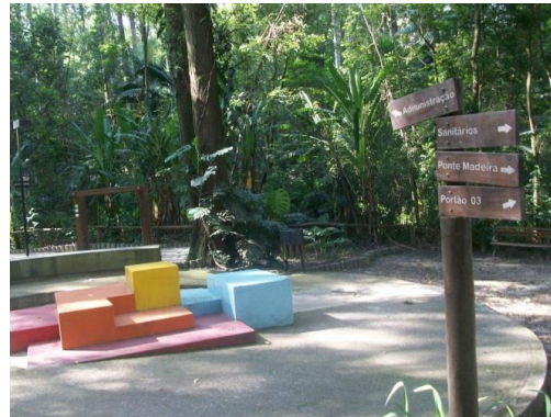
Figura 4: Parque Colinas de São Francisco – SP, Espaço de vivências ambientais.