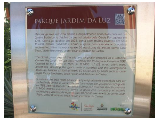
Figura 2: Parque da Luz - São Paulo, Placa. Figure 2: Parque da Luz - São Paulo, Plate.