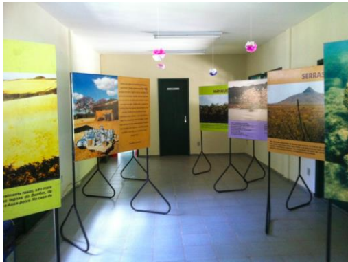
Figura 3: Parque das Dunas - RN, Espaço de Educação Ambiental.

características de cada parque, ou seja, de acordo com os objetivos para os quais foram criados (SILVA, 2012).