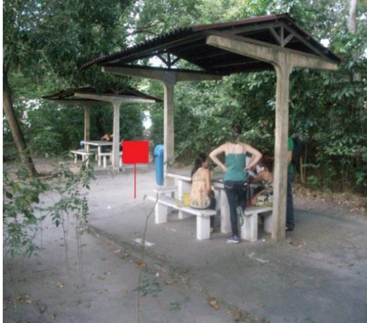
Figura 6: Local de implantação das placas, Bosque do CCS.

de direitos e democratização dos meios de comunicação (PEEA-ES, 2009, Art.21)". Ademais, a Educomunicação Ambiental busca o enfoque na comunicação direta e simples, onde qualquer pessoa possa interpretar e se conscientizar a partir da mensagem transmitida.